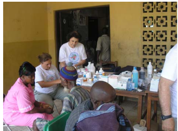
Ιατρείο στη Σιέρα Λεόνε