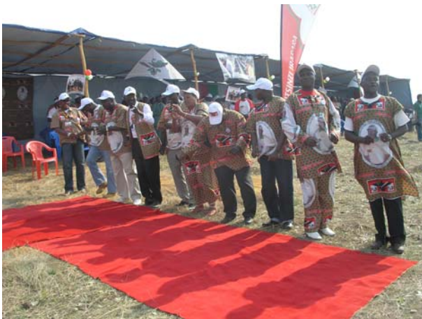
Τελετή εγκαινίων σχολείου στη Nyabikere