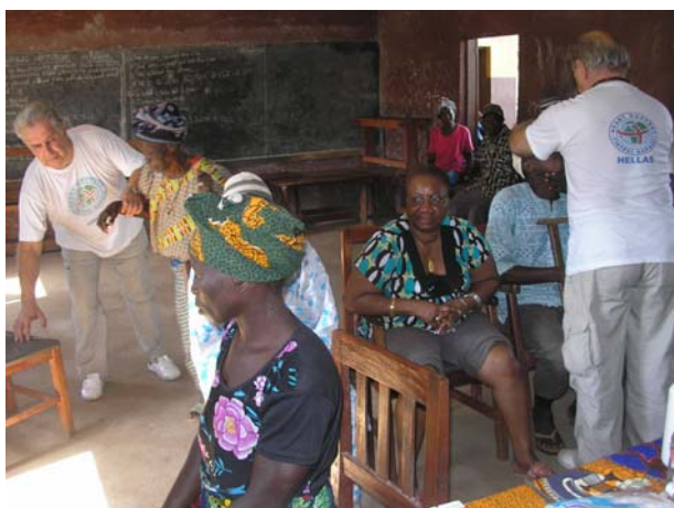
Ιατρείο στη Σιέρα Λεόνε

Τετραμελής ομάδα των «Γιατρών Καρδιάς» επισκέφθηκε το Διαμέρισμα Tonkolili που ανήκει στη Βόρεια Επαρχία της Sierra Leone και έχει πρωτεύουσα την πόλη Magburaka ( 400 χιλιόμετρα από την πρωτεύουσα Freetown ). Η ομάδα εγκαταστάθηκε στο χωριό Yelle και εκκινώντας από εκεί καθημερινά επισκέφθηκε τους οικισμούς Manono, Yebehen, Marak, Petifu Maγεροή και Mafay όπου εξέτασε πολλούς ασθενείς και χορήγησε τα αναγκαία φάρμακα. Διατέθηκε γάλα σε γονείς προκειμένου να το χορηγήσουν στα παιδιά τους που είναι καχεκτικά λόγω υποσιτισμού.