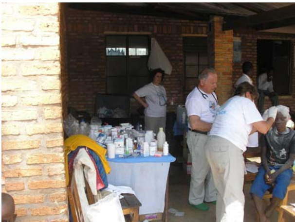
Ιατρείο στο Kirundo