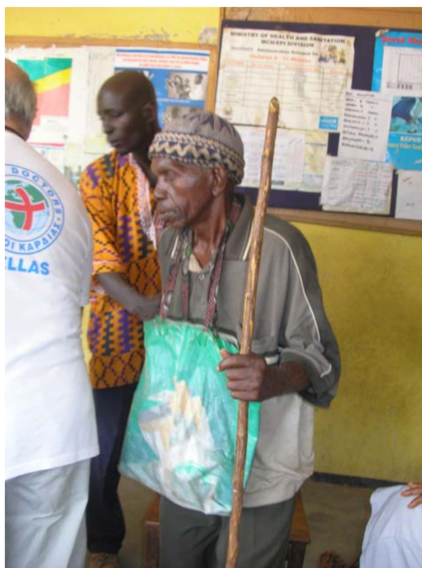
Σιέρα Λεόνε. Τυφλός στο γιατρό