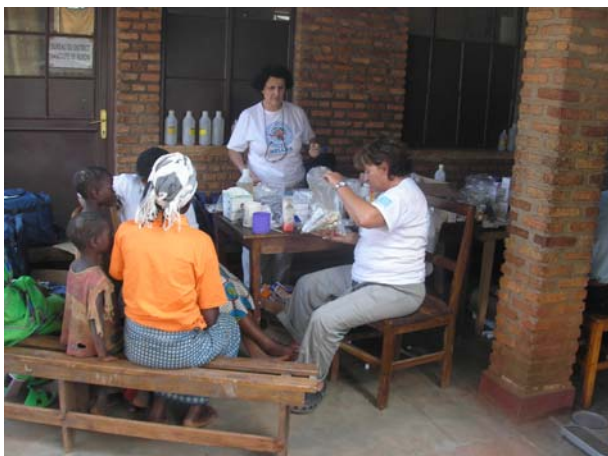
Ιατρείο σε μικρό χωριό της επαρχίας Karuzi στο Burundi