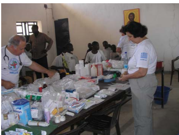
Ιατρείο σε αίθουσα του Ναού των Αγίων Αποστόλων