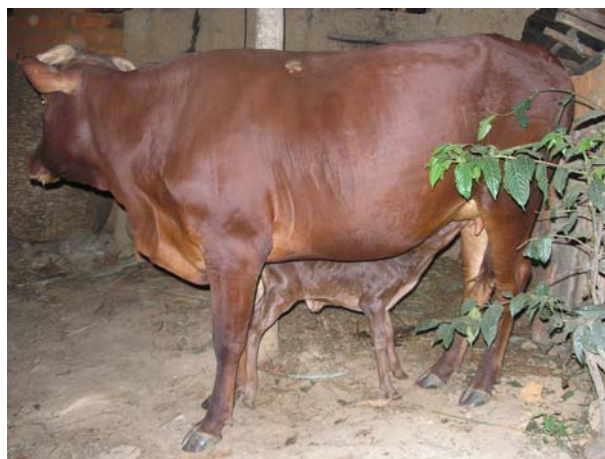
Αγελάδες που διανεμήθηκαν πέρυσι έχουν τώρα τα μοσχάρια τους