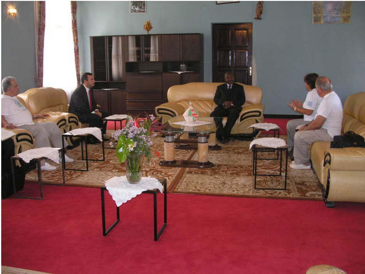
Επίσκεψη στον πρόεδρο της Δημοκρατίας στο Ngozi-Burundi