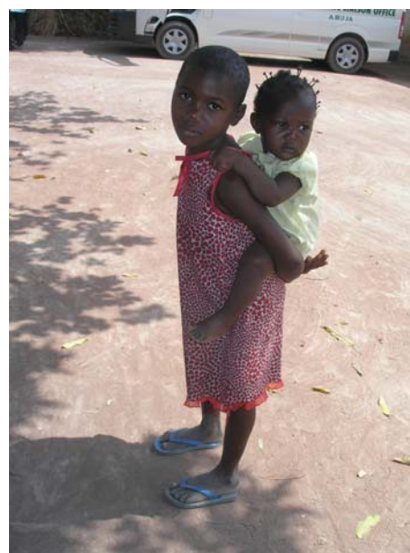
Στο γιατρό με το αδελφάκι στην πλάτη