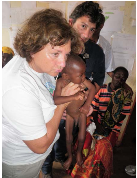
Ιατρείο σε απομακρυσμένο χωριό στο Burundi