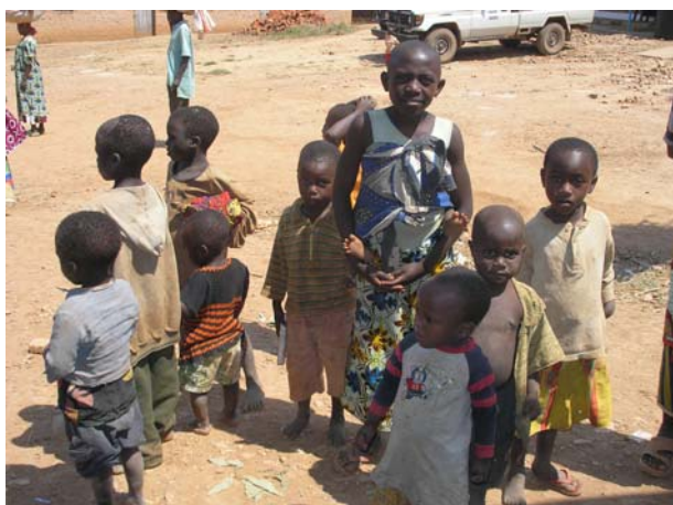
Παιδιά του Μπουρούντι