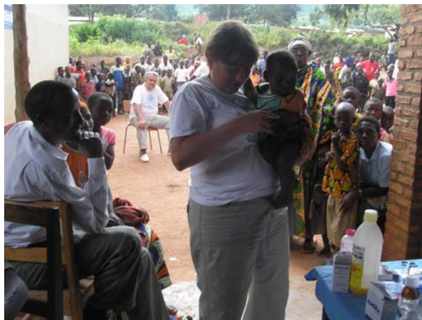
Ιδιαίτερη φροντίδα για τα μικρά