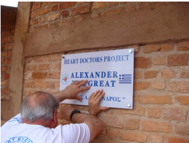
Σχολείο στη Nyabikere. Τοποθέτηση αναμνηστικής πινακίδας.