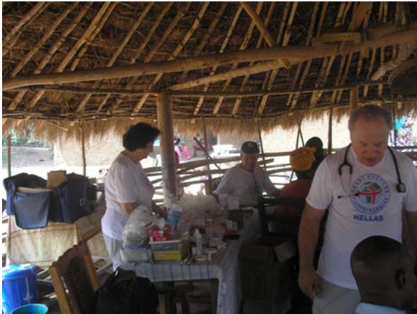
Ιατρείο στη Σιέρα Λεόνε