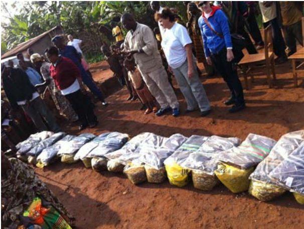
Διανομή τροφίμων στο Μπουρούντι