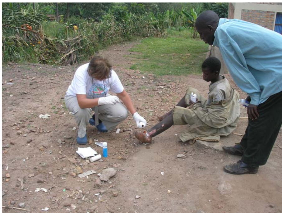
Μπουρούντι, παραμελημένο τραύμα