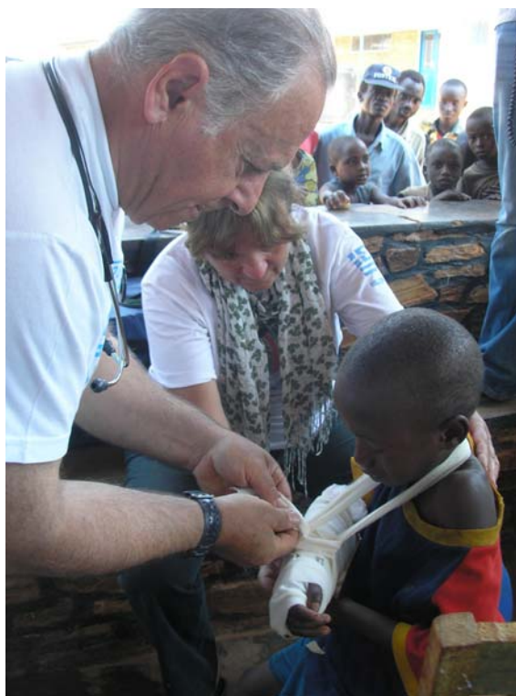
Πρόχειρος νάρθηκας στο κάταγμα αντιβραχίου του μικρού ασθενή