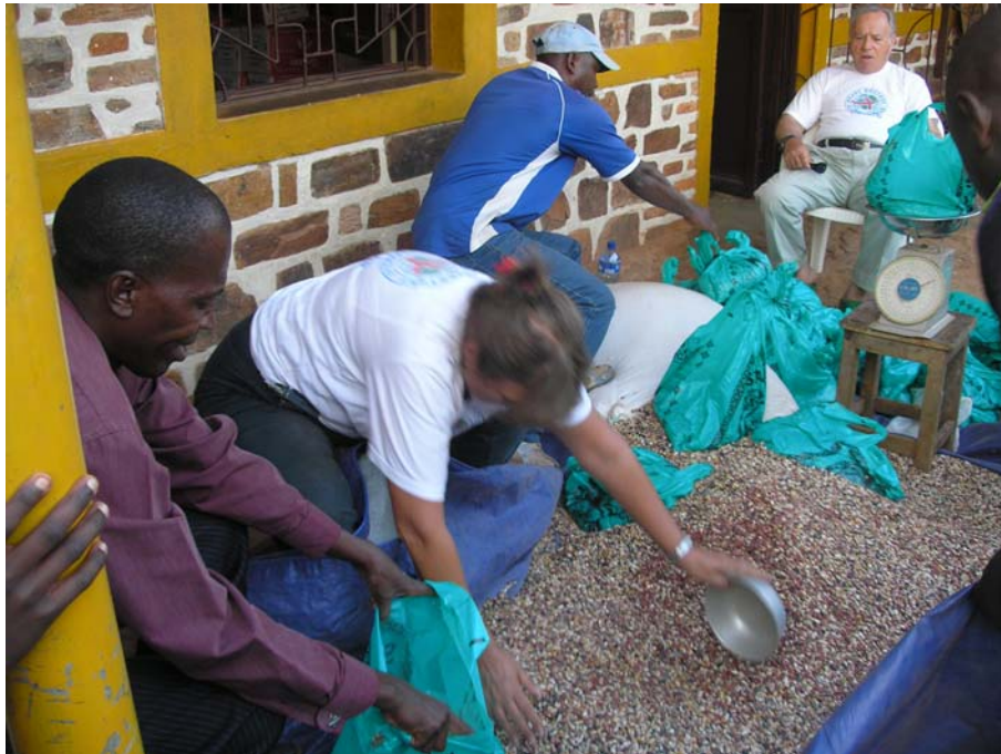
Διανομή τροφίμων στο Μπουρούντι