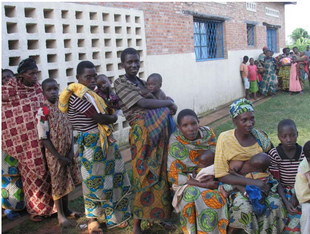
Μπουρούντι, μητέρες και παιδιά στο γιατρό