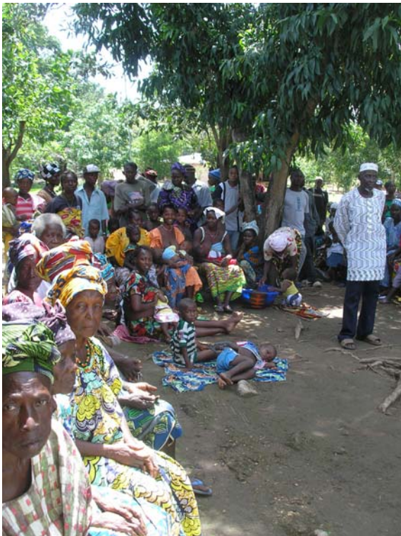
Ουρά ασθενών έξω από το ιατρείο