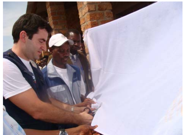
Εγκαίνια σχολείου στη Nyabikere