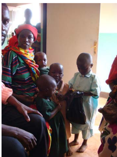
Karuzi. Γονείς με τα παιδιά τους στο ιατρείο.