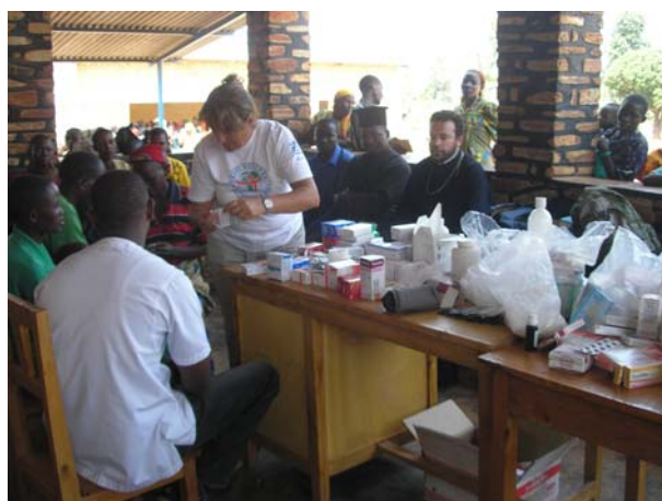
Με τον Αρχιεπίσκοπο Ρουάντας-Μπουρούντι στο Gisuru