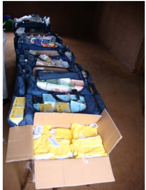
Φάρμακα ιατροφαρμακευτικής αποστολής

Στο Μπουρούντι προσφέρθηκαν νοσοκομειακά φάρμακα για ενδοφλέβια παροχή διατροφής σε χειρουργημένους ασθενείς ( αμινοacids ), αντιβιοτικά, παυσίπονα, αντισηπτικά, επιδεσμικό υλικό κλπ. για τις ανάγκες νοσοκομείων της χώρας.