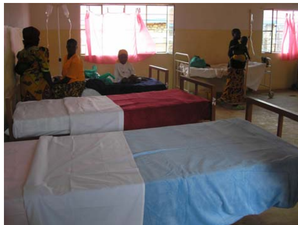
Κλινοστρωμνή στο νοσοκομείο του Gisuru.