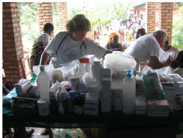
Ιατρείο στο Kirundo