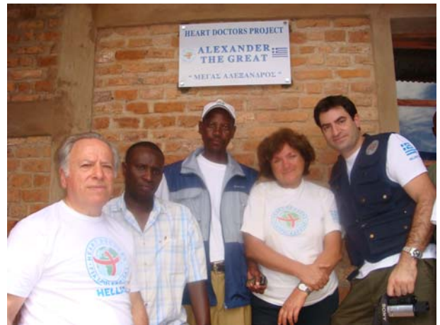
Nyabikere. Εγκαίνια του νέου σχολείου.