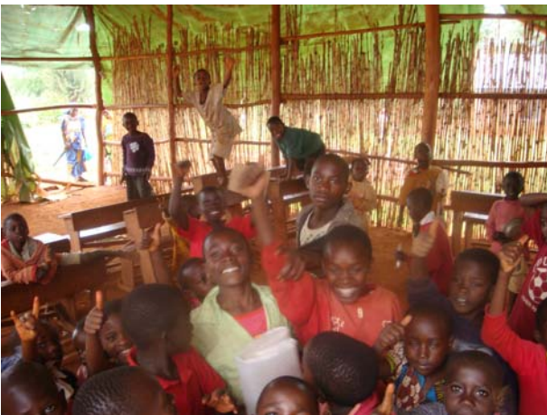
Nyabikere. Το παλιό σχολείο.

Στις 4.12.2009 ξεκίνησαν οι εργασίες ανέγερσης νέου κτηρίου για το σχολείο που λειτουργεί στην κοινότητα Nyabikere της επαρχίας Kaguzi στο Μπουρούντι. Οι «Γιατροί Καρδιάς» φρόντισαν να βρεθούν τα χρήματα για την κάλυψη του κόστους ανέγερσης και εξοπλισμού του κτηρίου, ενώ πραγματοποίησαν επανειλημμένες επί τόπου επισκέψεις για επιθεώρηση και συντονισμό των εκτελουμένων έργων. Στις 13.3 2010 τελέστηκαν τα εγκαίνια λειτουργίας του σχολείου, με την παρουσία του Διοικητή της επαρχίας, πολλών επισήμων και πλήθους κατοίκων της κοινότητας και της περιοχής. Στο νέο σχολείο δόθηκε η ονομασία «Αλέξανδρος ο Μέγας» και εντοιχίσθηκε σχετική αναμνηστική πινακίδα.