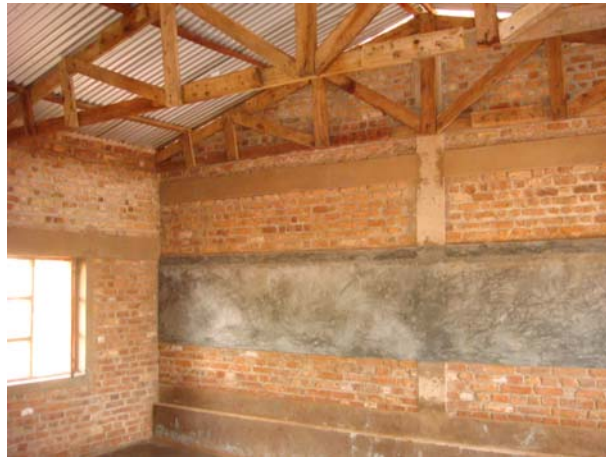
Από το εσωτερικό του σχολικού κτηρίου στη Nyabikere.