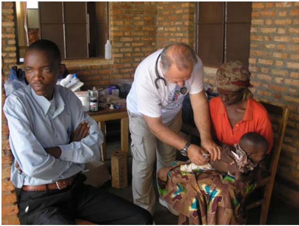
Ένεση στο μικρό που πάσχει από ελονοσία