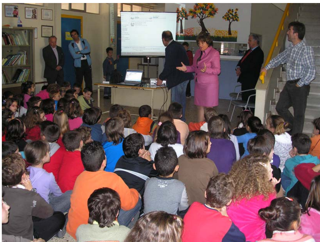
Σε σχολείο της Άμφισσας