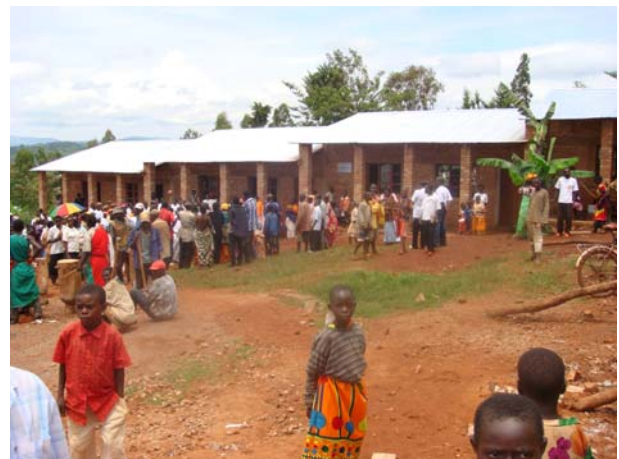
Nyabikere. Το νέο σχολείο.