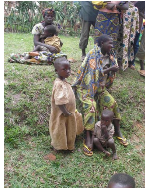
Έξω από το ιατρείο