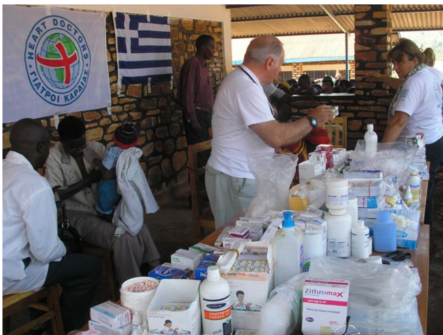
Ιατρείο στην επαρχία Gisuru

Ομάδα των «Γιατρών Καρδιάς» επισκέφθηκε την επαρχία Ruyigi, στο ανατολικό Μπουρούντι και πρόσφερε ιατρικές υπηρεσίες σε κατοίκους του συνοριακού οικισμού Gisuru που βρίσκεται σε απόσταση λίγων χιλιομέτρων από τα σύνορα με την Τανζανία. Στον οικισμό αυτό η Οργάνωση έχει ανεγείρει μεγάλο νοσοκομειακό συγκρότημα και στη διάρκεια αυτής της αποστολής πρόσφερε μεταλλικά κρεβάτια και είδη κλινικοστρωμνής για τις κλινικές του νοσοκομείου, ενώ τελέστηκαν και τα εγκαίνια κτηρίων που ανήγειραν οι «Γιατροί Καρδιάς» για τη στέγαση του νοσηλευτικού προσωπικού. Διανεμήθηκαν παιδικά ενδύματα και τρόφιμα.