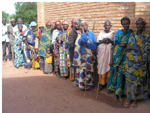
Ασθενείς σε ουρά έξω από το ιατρείο