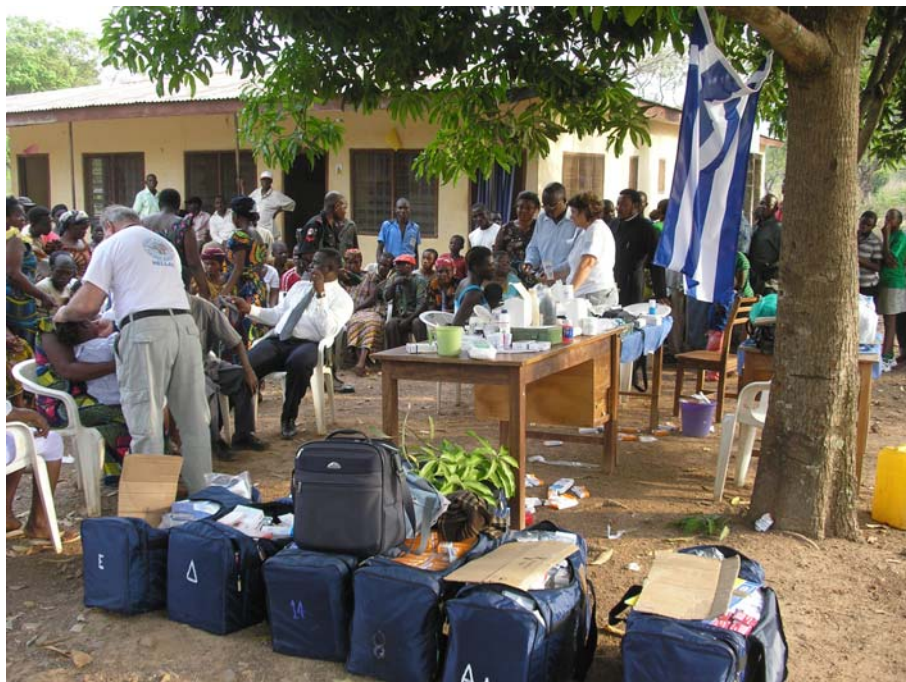
Υπαιθριο ιατρείο στη Νιγηρία

Τετραμελής ομάδα των «Γιατρών Καρδιάς», μετά από πρόσκληση των τοπικών Αρχών, επισκέφθηκε την Πολιτεία Βενουε και πρόσφερε ιατροφαρμακευτική περίθαλψη σε πληθυσμούς των απομακρυσμένων περιοχών Usar-Kwande, Nyihemba, Agu CHC και Chito.