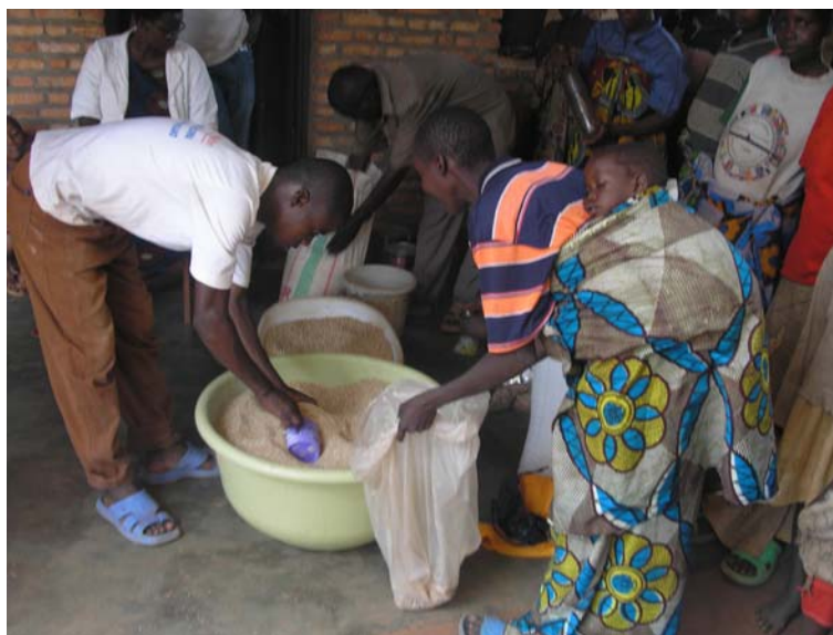
Διανομή τροφίμων στο Μπουρούντι

Οι «Γιατροί Καρδιάς» έχουν επιλέξει, ως κύριο τρόπο παροχής επισιτιστικής βοήθειας, την άμεση διανομή τροφίμων, διότι το έργο τους επικεντρώνεται στην αντιμετώπιση προβλημάτων άμεσης επιβίωσης, τα οποία από τη φύση τους έχουν υψηλή προτεραιότητα και κατεπείγοντα χαρακτήρα.