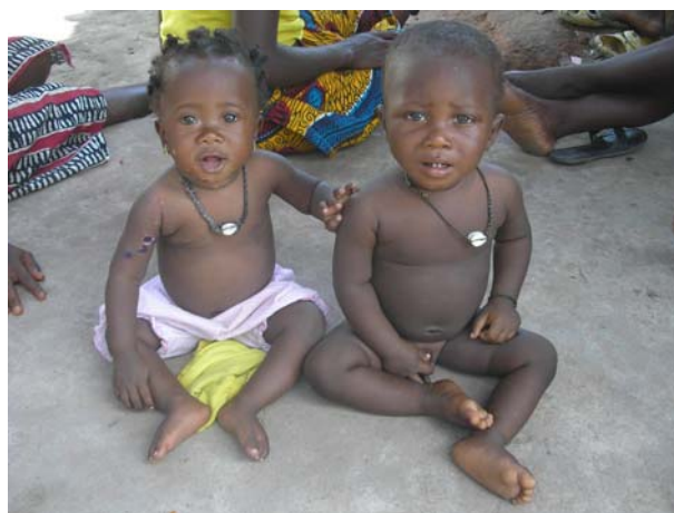
Περιμένουν να εξετασθούν