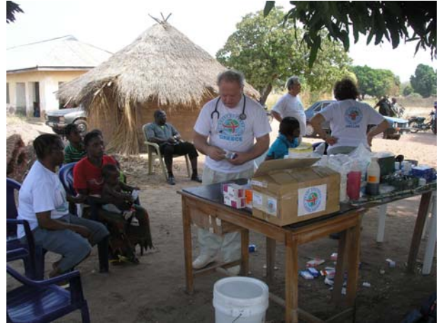
Ιατρείο στην Πολιτεία Βενουε, Νιγηρία