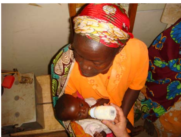
Γάλα για ασθενικά μωρά

Οι «Γιατροί Καρδιάς» επισκέφθηκαν την επαρχία Karuzi, στο ανατολικό Μπουρούντι και εργάστηκαν προσφέροντας ιατρική περίθαλψη σε πολλές κοινότητες της επαρχίας. Συγκεκριμένα, επισκέφθηκαν τις κοινότητες Shombo, Bugenyusi, Mutumba, Gihogazi και Nyabikere. Ο Κυβερνήτης της επαρχίας παρακολούθησε από κοντά όλες τις εργασίες της ομάδας των «Γιατρών Καρδιάς». Κατά τη διάρκεια της αποστολής αυτής πραγματοποιήθηκαν και τα εγκαίνια του σχολικού κτηρίου, που ανήγειρε η Οργάνωση στον οικισμό Nyabikere ( στο σχολείο δόθηκε η ονομασία «Μέγας Αλέξανδρος» ). Έγινε διανομή 20 αγελάδων σε πολύ φτωχές οικογένειες. Σε γυμνά παιδιά χορηγήθηκαν είδη ένδυσης. Στον οικισμό της Buramata έγινε διανομή τροφίμων σε οικογένειες που λιμοκτονούν.