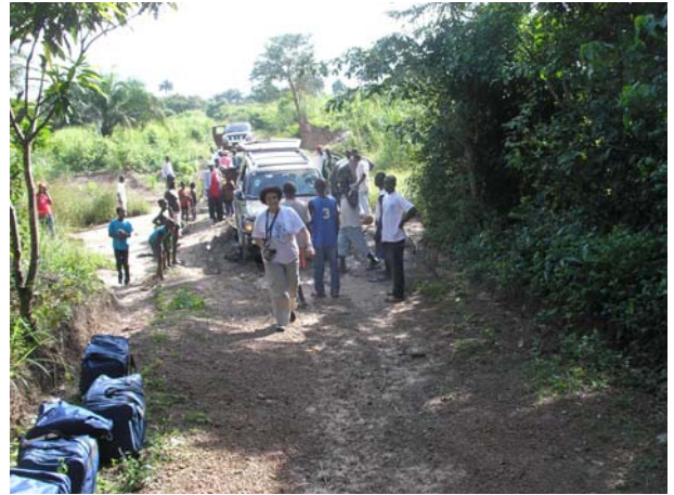
Τόπος για πρόχειρο ιατρείο, στη Σιέρα Λεόνε