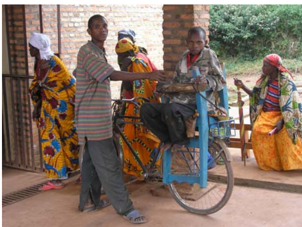
Ασθενείς προσέρχονται στο ιατρείο