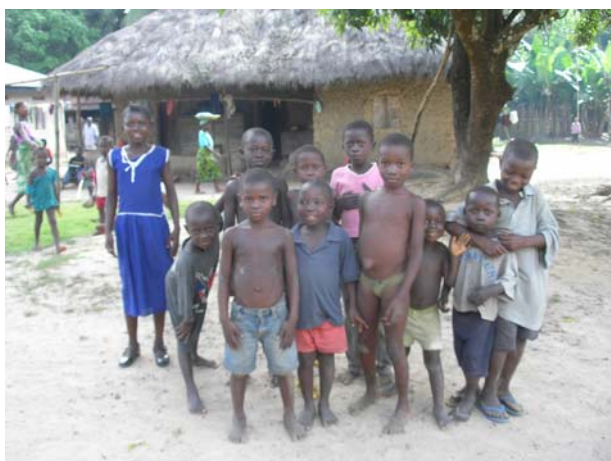
Παιδιά της Σιέρα Λεόνε