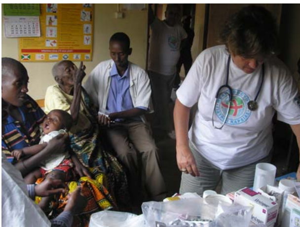
Ασθενείς στο ιατρείο

Στην αποστολή αυτή προσφέρθηκαν ιατρικές υπηρεσίες στους πληθυσμούς δυο επαρχιών: της επαρχίας Bubanza και της επαρχίας Kirundo. Στην επαρχία Bubanza, που βρίσκεται στο ΒΔ Μπουρούντι, οι γιατροί επισκέφθηκαν την κοινότητα Gihanga και συγκεκριμένα το χωριό Buramata, όπου έχουν ανεγείρει σχολεία και ιατρικό κέντρο και έχουν εκτελέσει μεγάλο έργο ύδρευσης του οικισμού. Στη βόρεια επαρχία Kirundo εργάστηκαν στους οικισμούς Burara, Cumno και Vumbi. Προσήλθαν και εξετάστηκαν πλήθη ασθενών. Διανεμήθηκαν τρόφιμα σε ομάδα άστεγων από τη Ρουάντα που διέμεναν στο δρόμο πλησίον του κυβερνείου στην πόλη Kirundo.