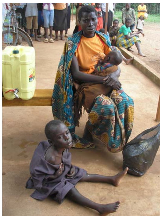
Μπουρούντι, περιμένοντας την εξέταση