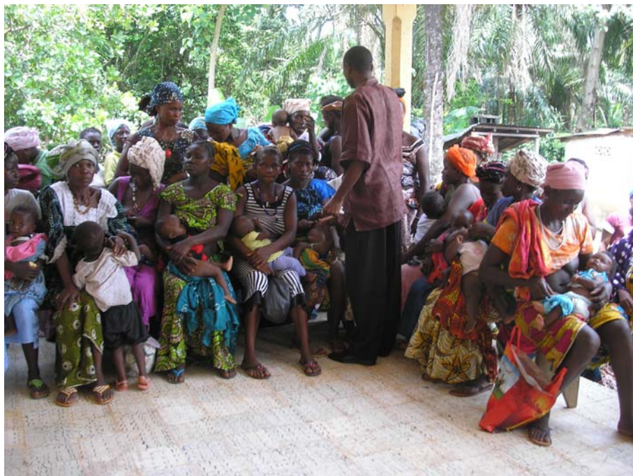
Σιέρα Λεόνε. Έξω από το ιατρείο