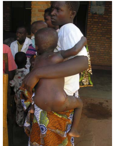
Παιδί με πολλαπλά αποστήματα