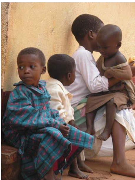
Παιδιά στο ιατρείο

Ιατροφαρμακευτική αποστολή οργανώθηκε και πραγματοποιήθηκε στην απομακρυσμένη επαρχία του Kirundo, που βρίσκεται στο βόρειο Μπουρούντι. Προσφέρθηκαν ιατρικές υπηρεσίες και τα αναγκαία φάρμακα σε πλήθη ασθενών που ζουν στις κοινότητες Busoni, Buga Bira, Gitobe και Vumbi. Έγινε και διανομή παιδικών ενδυμάτων σε παιδιά που έχουν υποτυπώδη ένδυση.