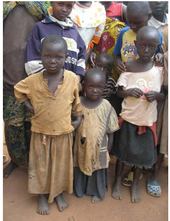
Παιδιά του Μπουρούντι