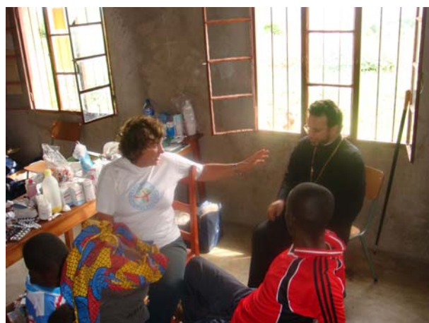
Με τον Αρχιεπίσκοπο Ρουάντας-Μπουρούντι στο Karuzi