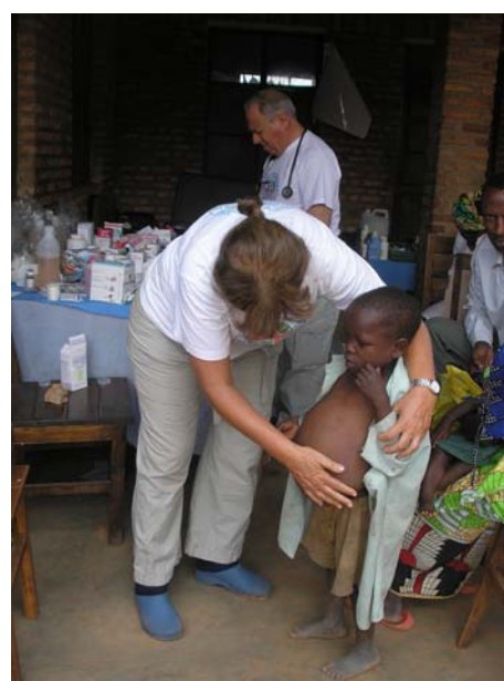
Διανομή παιδικών ενδυμάτων