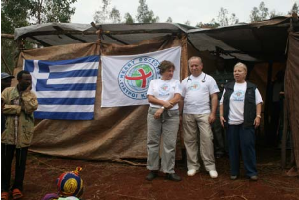
Πρόχειρο υπαίθριο ιατρείο στο Μπουρούντι