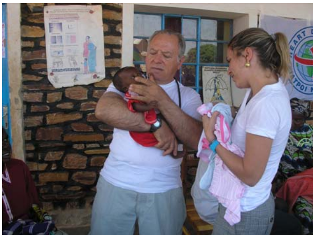
Μικρούλης ασθενής με ελονοσία και αναιμία στο ιατρείο Gisuru