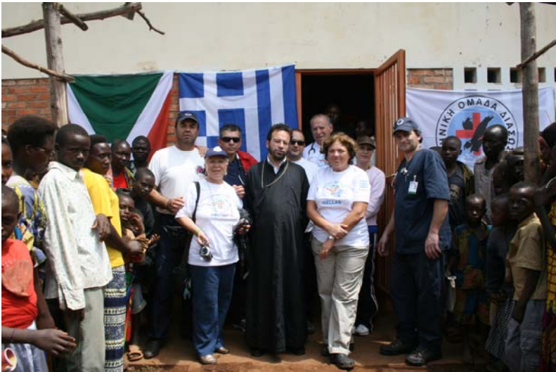
Με τον Αρχιεπίσκοπο Ρουάντας-Μπουρούντι και την Ελληνική Ομάδα Διάσωσης