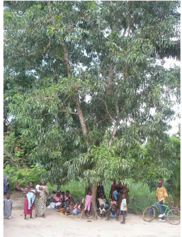
Συγκεντρωμένοι ασθενείς περιμένουν να εξετασθούν