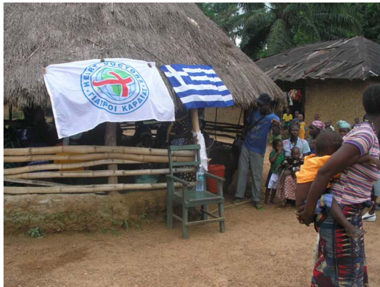
Έξω από το ιατρείο στη Σιέρα Λεόνε