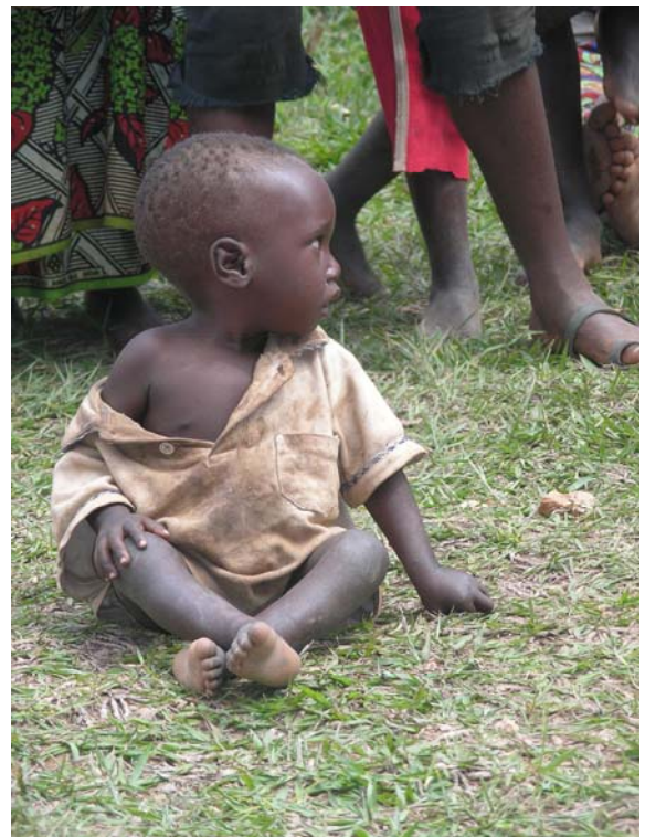
Περιμένει να εξετασθεί