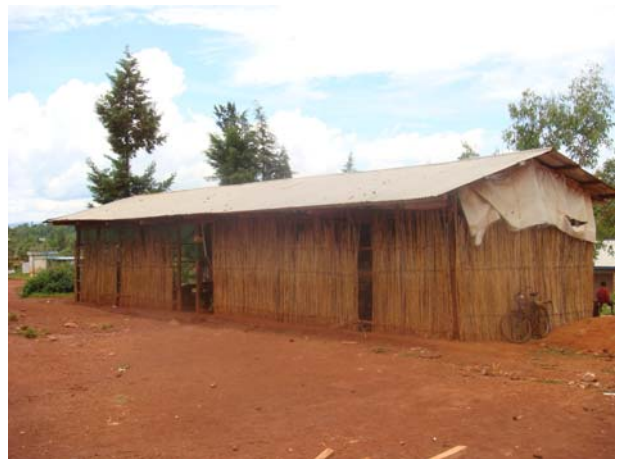
Nyabikere. Το παλιό σχολείο.