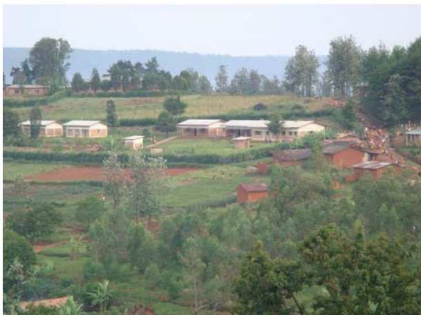
Νοσοκομείο στο Gisuru. Πτέρυγα διαμονής νοσηλευτικού προσωπικού.

Αγοράστηκαν 50 μεταλλικά κρεβάτια, κουβέρτες και λοιπά είδη κλινοστρωμνής κλπ. και τοποθετήθηκαν στις διάφορες κλινικές του νοσοκομείου. Ολόκληρο το νοσοκομείο είναι εξοπλισμένο με τα απαραίτητα που απαιτούνται για την καλή λειτουργία του. Η Ομάδα μετέφερε για το σκοπό αυτό από την Αθήνα σεντόνια, κουβέρτες και άλλα είδη.