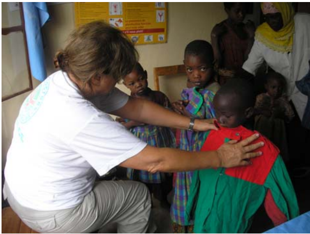
Διανομή παιδικών ενδυμάτων