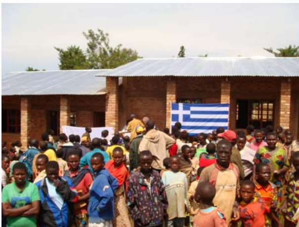
Nyabikere. Εγκαίνια του νέου σχολείου.