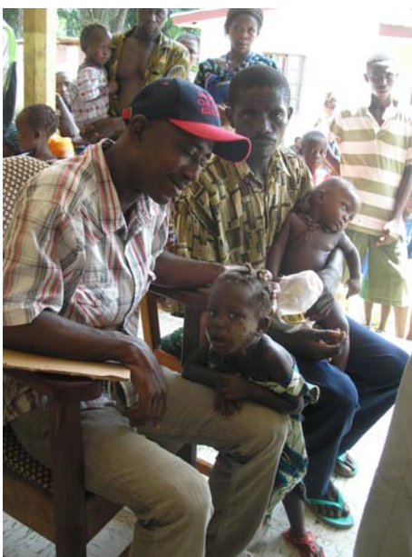
Γονείς με τα άρρωστα παιδιά τους περιμένουν να εξετασθούν