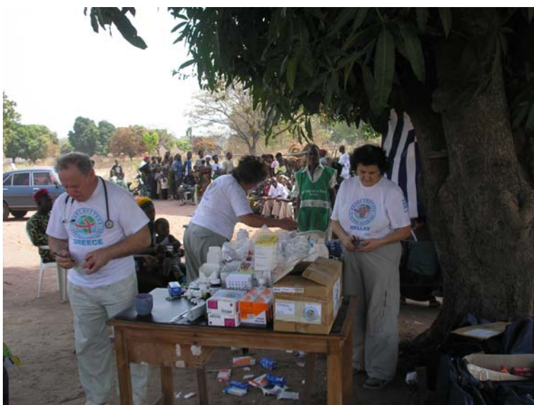
Υπαιθριο ιατρείο στη Νιγηρία