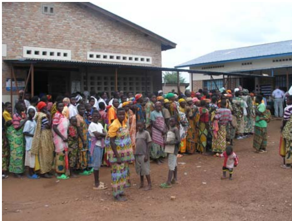
Ασθενείς που περιμένουν να εξετασθούν