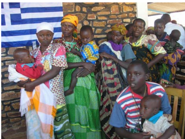
Γονείς με τα παιδιά τους στο ιατρείο