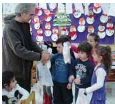
Προσφορά φαρμάκων από παιδιά του 5ου Νηπιαγωγείου Κερασινίου

Κατά το έτος 2013 πρόσφεραν στους «Γιατρούς Καρδιάς» σχολικά είδη, ενδύματα και αθλητικά είδη για το Μειονοτικό Δημοτικό Σχολείο Ηλιόπετρας: ο Σύλλογος Γονέων και Κηδεμόνων της Σχολής Μωραΐτη, το βιβλιοπωλείο «Κλεψύδρα» στα Καλύβια Θεορικού και ο Γυμναστικός Αθλητικός Σύλλογος Καλυβίων Θεορικού.