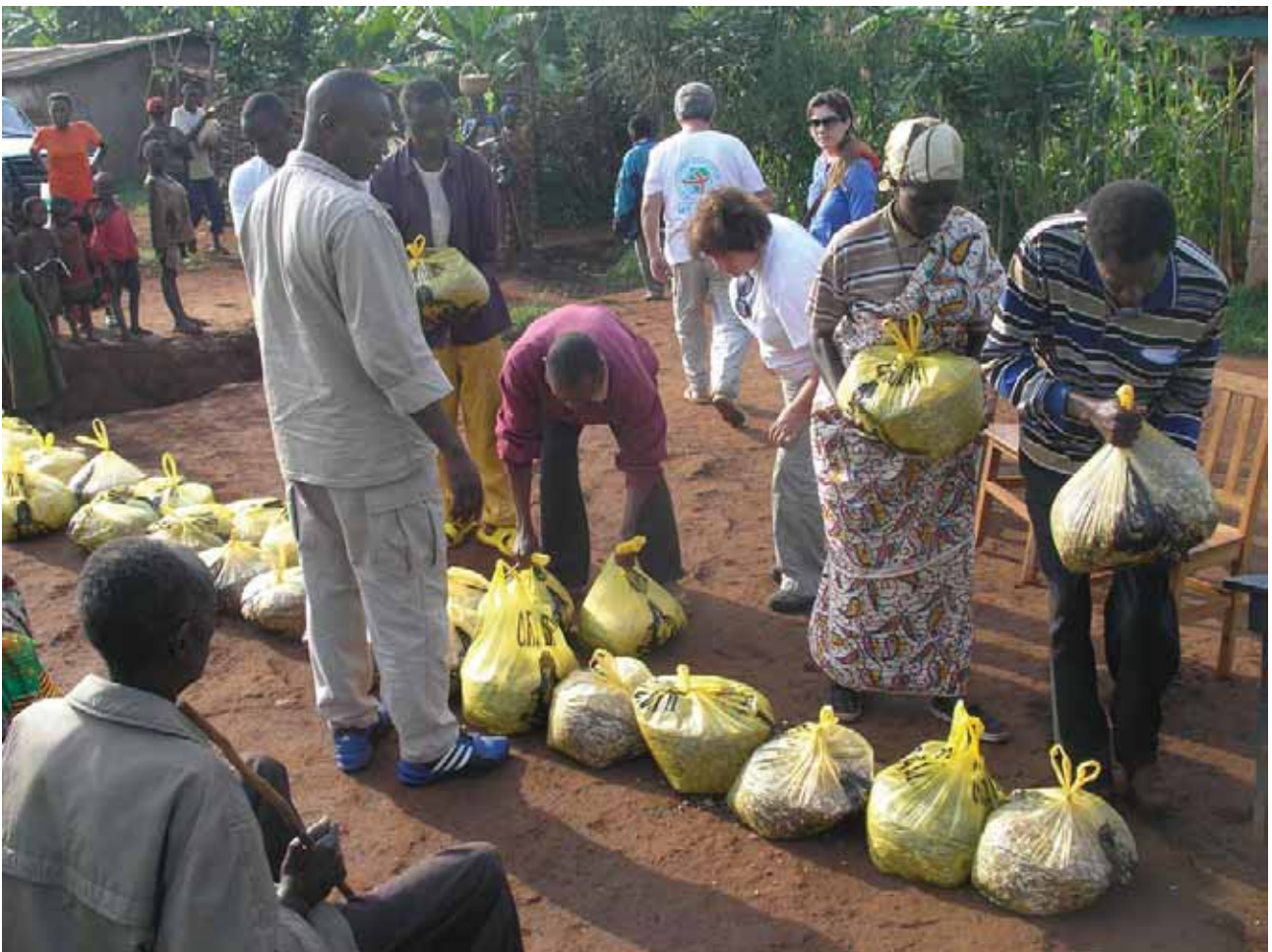
Διανομή Φασολιών στο Μπουρούντι

Δυσκολίες αντιμετωπίζονται σε περιπτώσεις χωρών όπου δεν υπάρχουν επαρκή τρόφιμα στο εσωτερικό τους ( Σομαλία ). Τότε τα τρόφιμα αγοράζονται από γειτονικές χώρες και διανέμονται στους κατοίκους που λιμοκτονούν και βρίσκονται πλησίον των συνόρων.