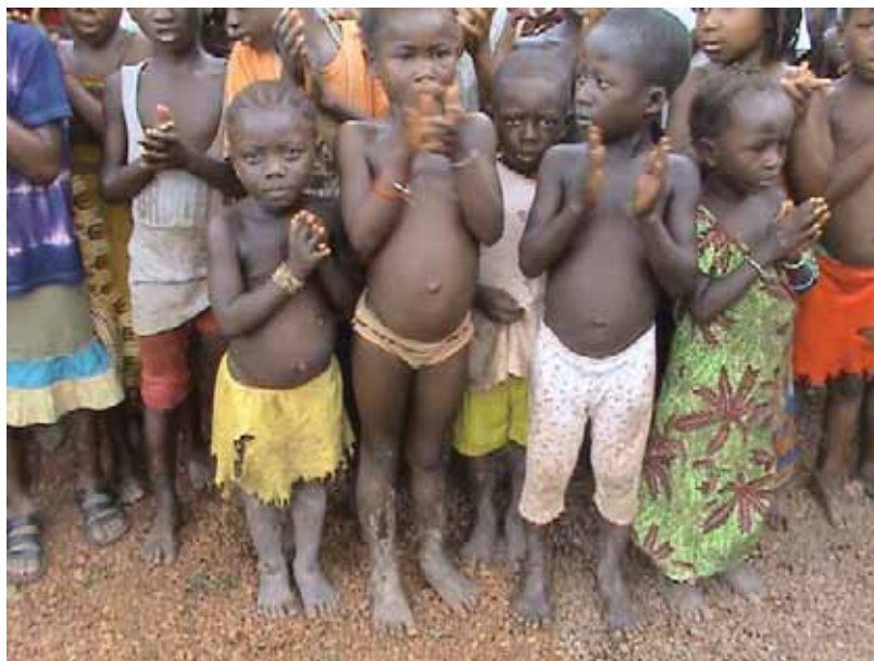
Παιδιά της Σιέρα Λεόνε