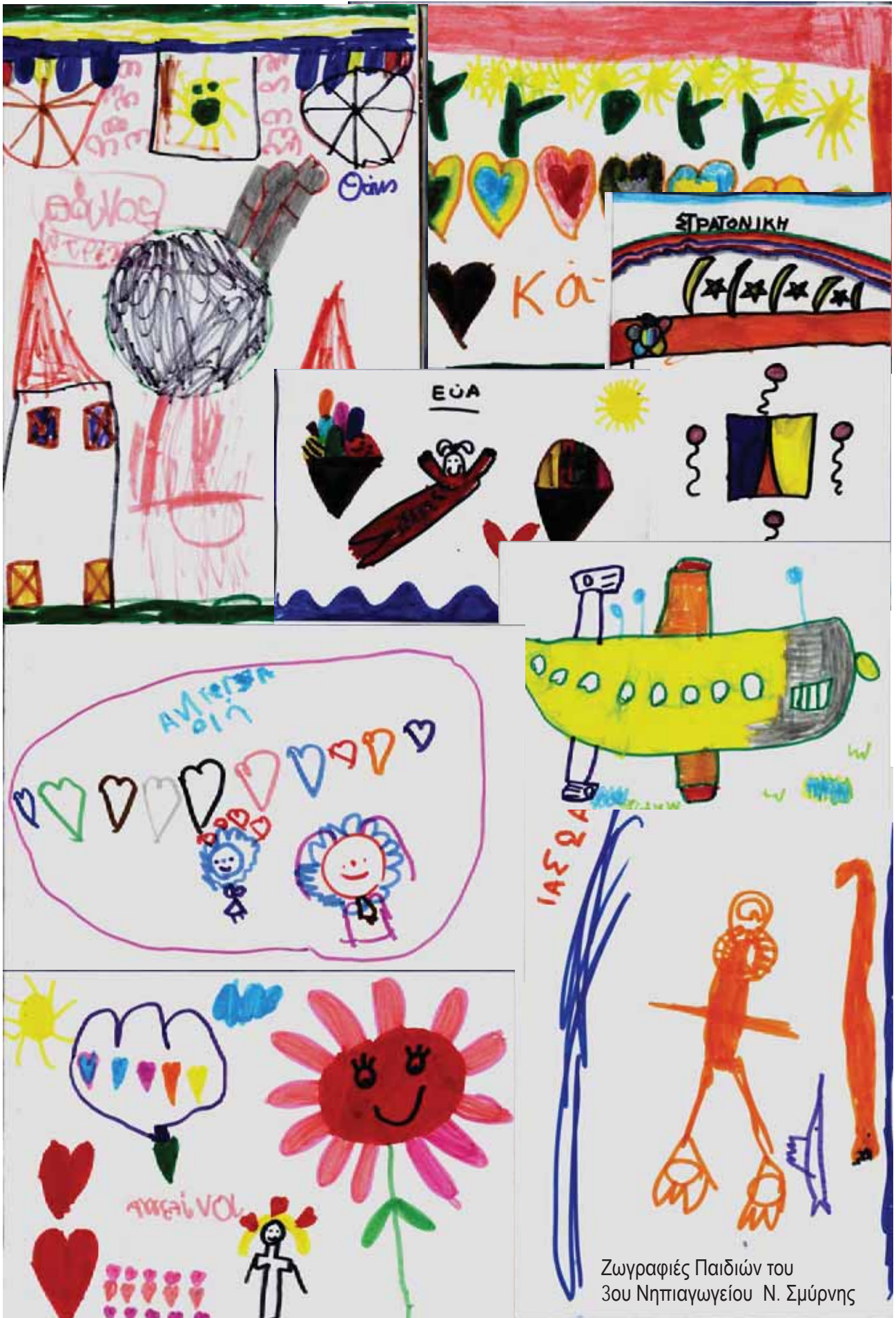
Ζωγραφιές Παιδιών του 3ου Νηπιαγωγείου Ν. Σμύρνης