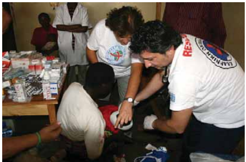
Η Ελληνική Ομάδα Διάσωσης μετέχει